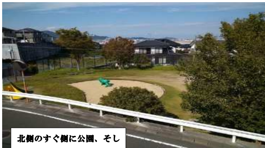
北側のすぐ側に公園、そして能古島が見えます。