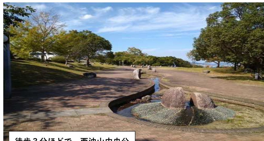
徒歩3分ほどで、西油山中央公