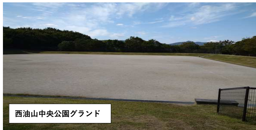
西油山中央公園グランド